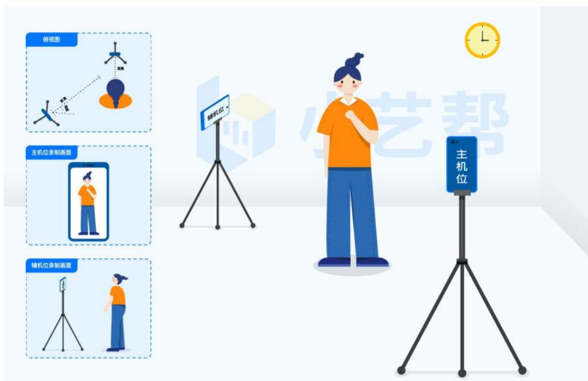
“步态行走”考试科目拍摄参考图

3.检查网络信号，确保网络稳定流畅，避免出现断网等情况影响正常考试。不得在同一网络环境下聚集考试，以避免在考试中出现因网络不畅导致考试中断、内容丢失等情况。